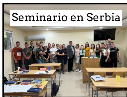
Seminario en Serbia