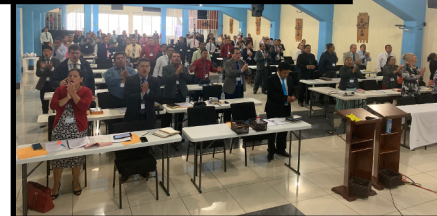
Cinco seminarios en Centroamerica.