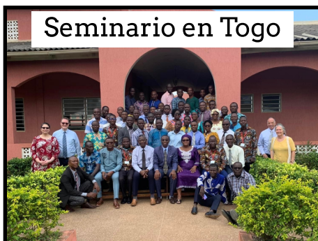
Seminario en Togo

La AGET es el brazo oficial de entrenamiento ministerial de Misiones Globales de la Iglesia Pentecostal Unida Internacional.