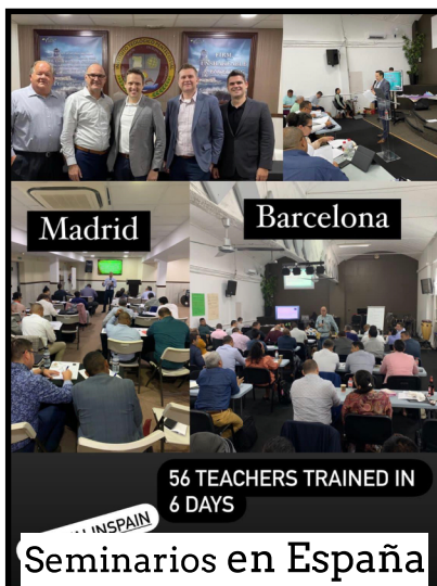
Seminarios en España