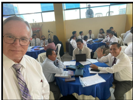
Seminario de AGET con los maestros en Peru