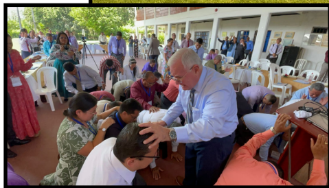
Un seminario increíble en Cali, Colombia