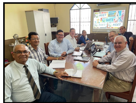
Tres seminarios regionales en Brasil y una reunión muy eficaz con los líderes.